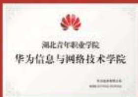
与华为共建华为信息 与网络技术学院