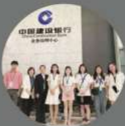
会计专业师生考察实习就业基地