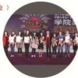
艺术设计专业学生参加 中国大学生广告艺术节学院奖颁奖典礼仪式