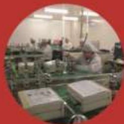
通信技术专业生产性实训基地

就业岗位群: 通信电子产品加工制造岗位,通信设备设计、开发、运营和技术管理岗位以及通信设备的营销、装配、调试、维修和检验等技术工作岗位。