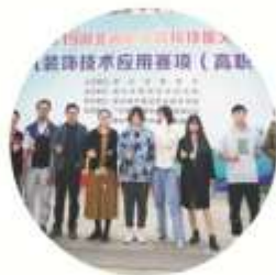
建筑室内设计专业学生参加2019年 湖北省职业院校技能大赛