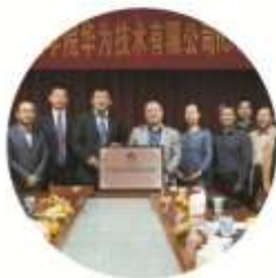
与华为合作签字仪式