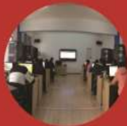
信息工程系教学做一体化教室

就业岗位群: 主要面向企事业单位信息技术部门,信息安全管理相关部门,以及信息安全服务类公司的岗位。主要包括:信息系统安全运维与管理,网络安全系统运维管理,信息安全管理,渗透测试,安全防护,安全咨询与服务,安全产品与技术售前/售后技术支持等。