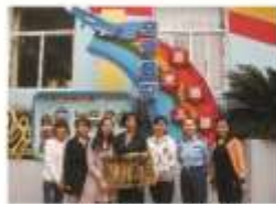
空军武汉蓝天幼儿园 实训基地

就业岗位群： 西部计划指定报考公务员岗位、团省委、团市委青少年事务岗位、青少年社会工作、民政系统岗位、政府购买社工岗位、机构社工、驻校社工、办公室职员、企事业单位文员等。