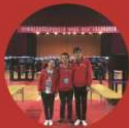
计算机网络技术专业的学生 参加湖北省职业技能大赛荣获一等奖

就业岗位群: 主要面向事业单位、大中小企业,从事网络布线、网络设备安装和调试,网络设备及网络服务器系统的配置等工作。主要包括:网络管理员,系统集成工程师,网络运维工程师等。