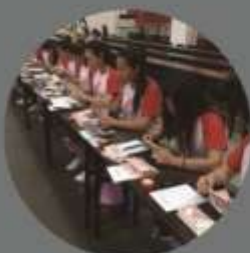
会计专业点钞技能大赛