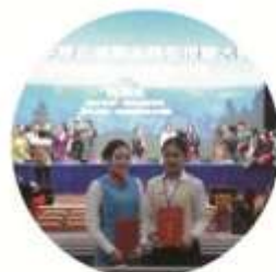
旅游管理专业学生参加湖北省职业院校技能大赛获一等奖

就业岗位群: 中国旅行社等旅行集团,从事旅游景区中英文导游服务、海外领队、订制导游、自驾导游、户外穿越导游,旅行社计调,销售外联,旅游咨询,旅游电子商务等岗位。