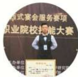
酒店管理专业学生参加湖北省职业院校技能大赛荣获一等奖

就业岗位群: 高星级国际品牌酒店营销、人力资源、餐饮、客房、前厅、调酒及茶艺等服务与管理岗位。