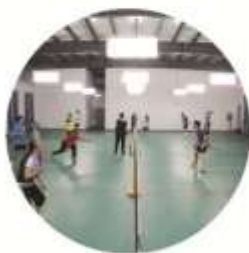
师生在室内羽毛球馆竞赛

为切实保证经济困难学生顺利完成学业,学校建立了经济困难学生入学“绿色通道”制度。即对被录取的经济困难新生,采取奖、助、贷、补、减、免等多种办法,确保每位新生不会因经济困难而无法入学。