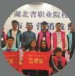
2019年市场营销专业学生 获湖北省职业院校技能大赛三等奖

就业岗位群: 政府机关、银行、会计师事务所等各类企事业单位,从事出纳、会计、审计、税务及财务管理岗位。