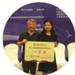
展示艺术设计专业老师荣获 第二届全国会展教师微课大赛一等奖

就业岗位群: 展台展厅设计、商业空间设计、展览馆空间设计等领域的设计、管理工作。