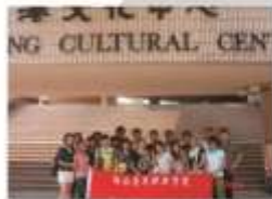
社会工作专业学生 在香港游学实训